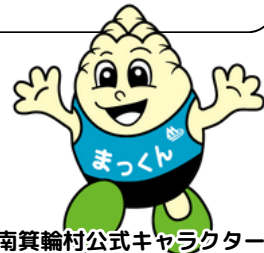
南箕輪村公式キャラクター 「まっくん」