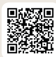
観光協会HP (実施要項もこちら)